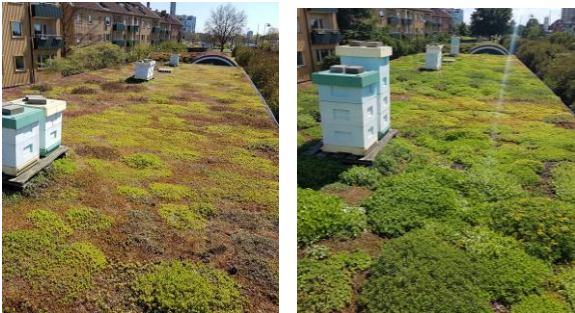
Ovan är bilder från vegetationsutveckling på sedumtak i Malmö efter gödsling med organisk gödselgiva i kombination med lättviktsjord.

Med sitt utsatta läge riskerar sedumtak att få brist på näring och vatten, vilket kan resultera i uttorkning och erosion. Ett utmattat sedumtak bidrar inte med de ekosystemtjänster det är anlagt för att göra. Vi erbjuder ett koncept med gödsling och restaurering av nedgådda sedumtak genom tillförsel av biokol, KRAV-märkt maskkompost och dress med lättviktsjord för gröna tak.